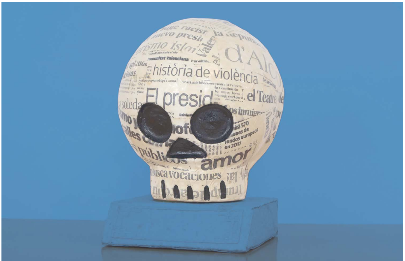
Premi Mostra de Teatre d'Alcoi, obra de Rafa Gordillo