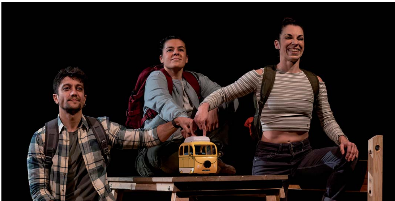
CAOS (Teatre de l'Abast)