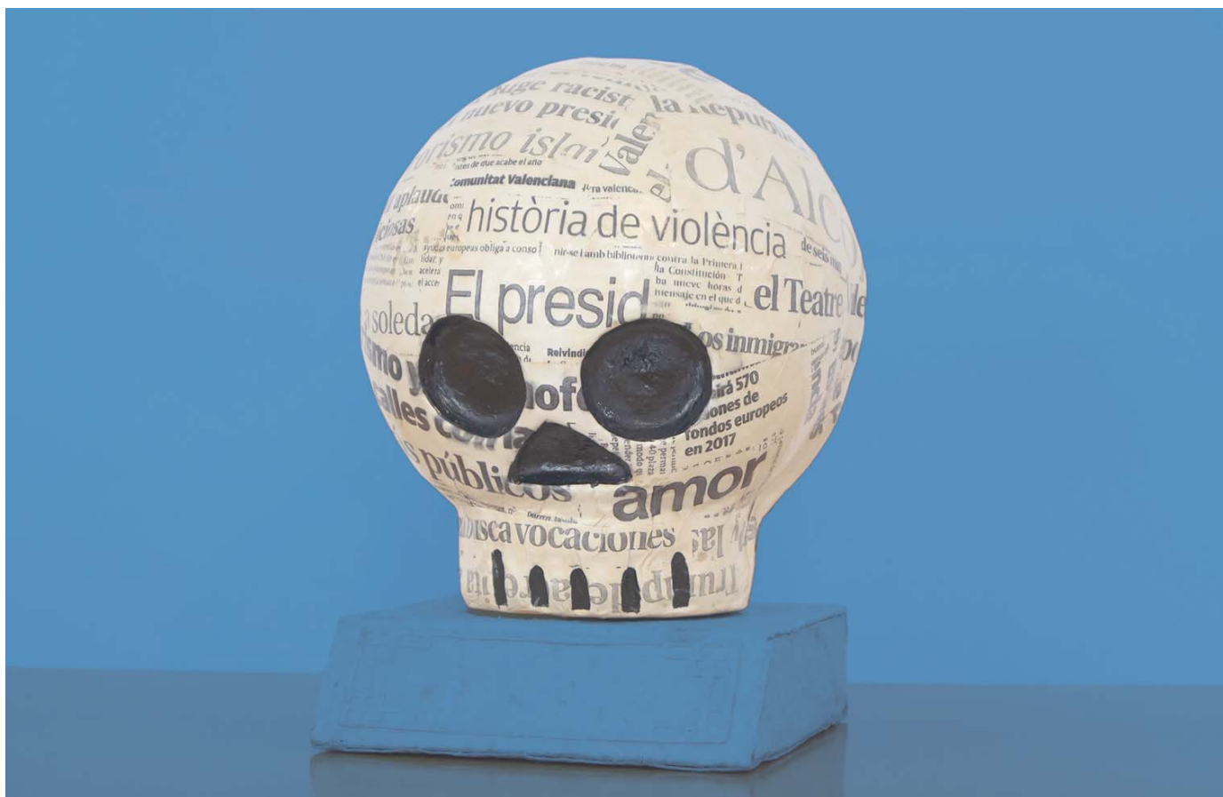
Premi Mostra de Teatre d'Alcoi, obra de Rafa Gordillo