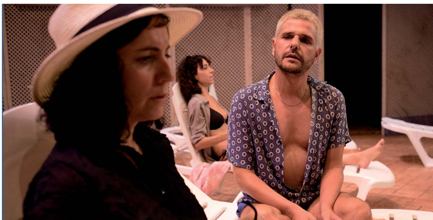
4 DÍAS, 4 NOCHES (La Portuaria)