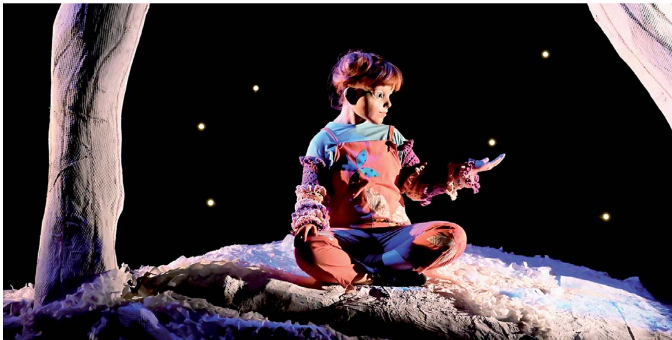
EL BOSQUE DE COCO (La Buena Compañía)